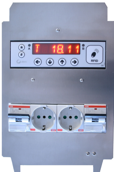
ABB CEWE insats